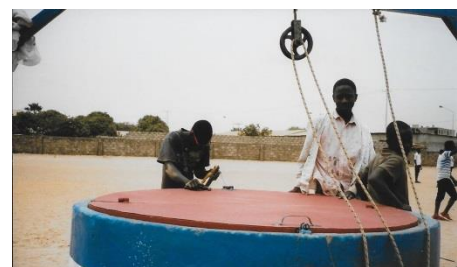
Watervoorziening voor de school

De vervoerskosten van deze pallets drukken zwaar op onze exploitatie. Vorig jaar € 500,-. Wij zoeken sponsoren die deze lasten willen dragen. Die € 500,- kunnen we ook goed gebruiken voor onze onderwijsdoelstellingen.