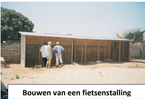
Bouwen van een fietsenstalling

Verhogen van de muren rond het schoolplein, uitbreiding aantal