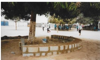
Bouwen en verven van zitjes voor de leerlingen

Wij vragen u om ook te kijken op onze website: WWW. Onderwijsgambia.nl Daar vindt u alle gegevens van onze Stichting en ook een lijst van bruikbare goederen, onder kopje NIEUWS. Wij zorgen voor het inpakken en verzenden.