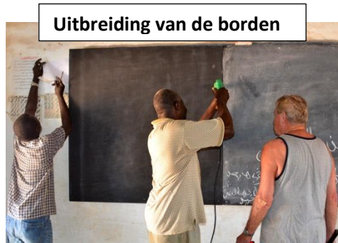
Uitbreiding van de borden

De Stichting is opgericht 17 februari 2009 en heeft als doelstelling om de onderwijsvoorzieningen en het onderwijs van de Ahlus Suffahschool te verbeteren.