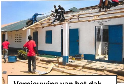
Vernieuwing van het dak

In deze brief staat een aantal foto's van projecten die wij dankzij de sponsoring hebben kunnen verwezenlijken.