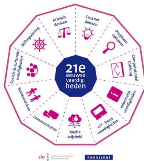
Figuur 2: Het model voor 21 e eeuwse vaardigheden (21st century skills) zoals het is ontwikkeld door SLO en Kennisnet. Geraadpleegd via: https://www.kennisnet.nl/artikel/6648/alles-wat-u-moet-weten-over-21e-eeuwse-vaardigheden/

Het model voor 21 e eeuwse vaardigheden (zie Figuur 2) laat zien dat sociaal-emotionele competentie óók in de toekomst van groot belang is. Communiceren, samenwerken,